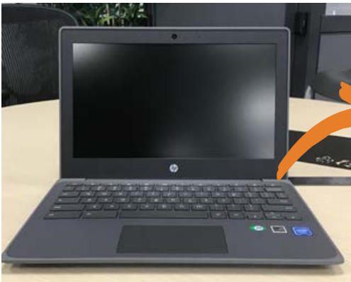
HP Chromebook 11

Có sẵn tại tất cả các Địa điểm Thư viện Công cộng San José